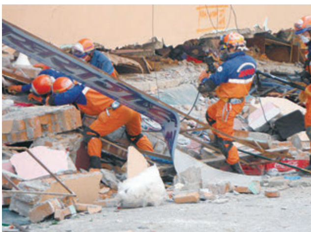
ゴンガブ地区での1階、2階が座屈したホテルに おける高度救助資機材を使用した搜索救助活動 (平成27年4月ネパール連邦民主共和国における大地震災害)