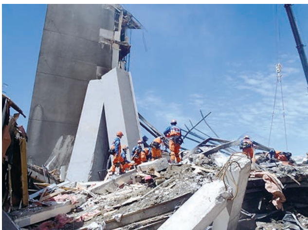
CTVビルでの搜索救助活動 (平成23年2月ニュージーランド南島における大地震災害)