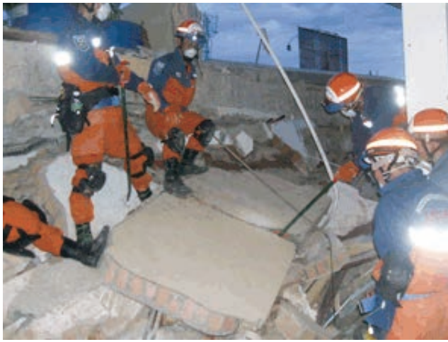
パダン市街地における搜索救助活動 (平成21年10月インドネシア西スマトラ州における大地震災害)